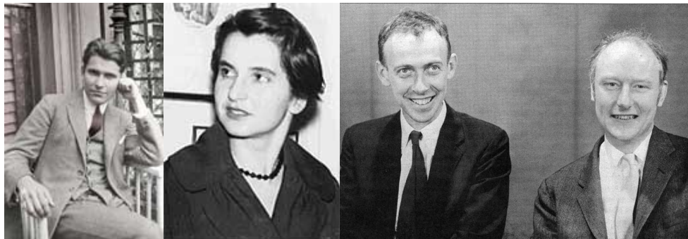
Chargaff, Franklin, Watson i Crick